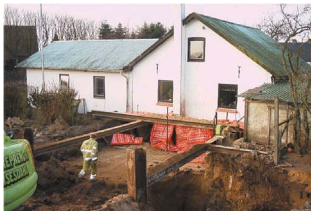
Figur 2. Udgravning, pælevæg og modholdspæle (set fra øst).

RAMBØLL anbefalede en bortgravning af forurenede jord uden for bebyggede områder. For at sikre bygningens fundament blev der etableret en afstivning langs beboelsens østgavl, fyrrummets sydgavl og østfacade, jf. figur 2. Afstivningen blev udført med tætstillede Ø600mm betonpæle ført 5-6 m u.t. På lokaliteten blev i alt 677 tons forurenede jord bortgravet.