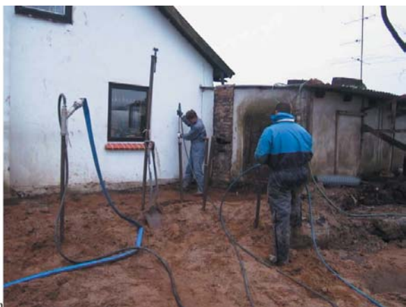
Figur 3. Manuel Biogel™ behandling med lanser og behandling via stålrør, ført inder under fyrrum/beboelse.

Fra udgravningsfeltet og mod syd havde forureningen bredt sig langs kloakledningen. Forureningen var afgrænset til et mindre sammenhængende område på ca. 8 m 2 , fra 1,5 til 2,5 m u.t. I dette område blev der ligeledes foretaget behandling med Bio-Gel™. Der blev injiceret ned til ca. 3 m u.t. i et net på ca. 0,75 m mellem injektionspunkterne.